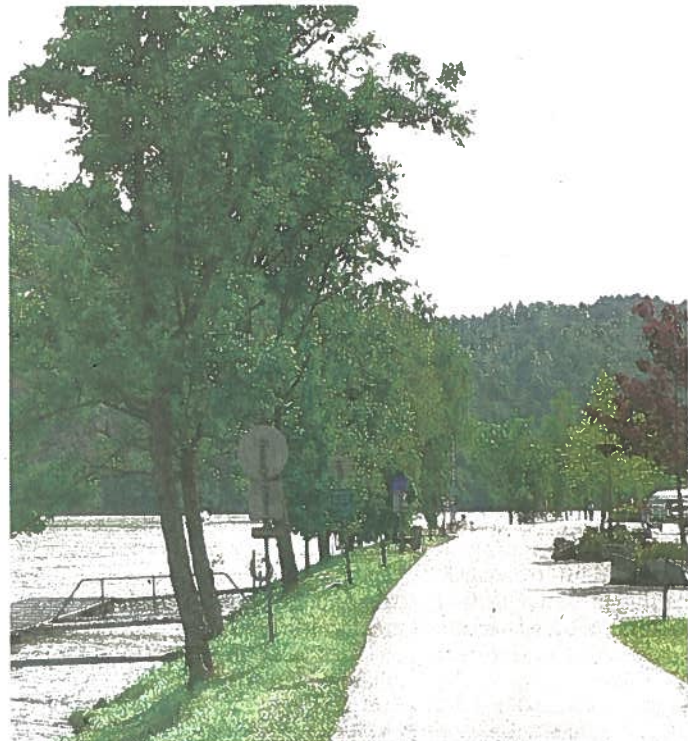
Des pistes cyclables sécurisées longent le Danube.

le. Nous y sommes arrivés sans être entraînés. Et puis si vraiment un jour on ne veut ou ne peut pas pédaler, il y a le bateau, le bus ou le train. »